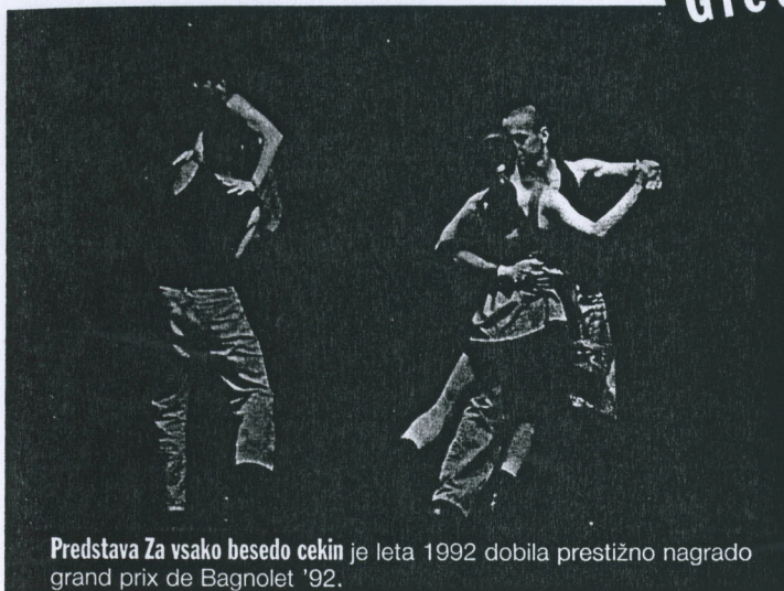
Predstava Za vsako besedo cekin je leta 1992 dobila prestižno nagrado grand prix de Bagnolet '92.