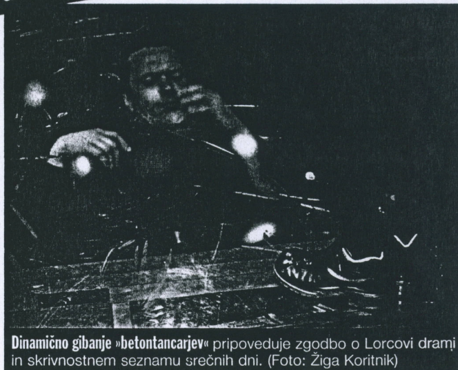
Dinamično gibanje »betontancarjev« pripoveduje zgodbo o Lorcovi drami in skrivnostnem seznamu srečnih dni.

ne izreka besed, so zastavljene kot natančna zgodba o medčloveških odnosih, o nasilju in nežnosti, o prevari in prijateljstvu. Njihova gibljivost in značilna montaža prizorov prej spominja na film kot na gledališče. »Živel sem od opazovanja ulice, kukan-